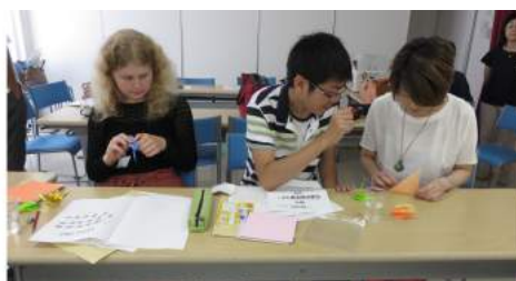
「原爆の子の像」に捧げる折鶴を練習する留学生