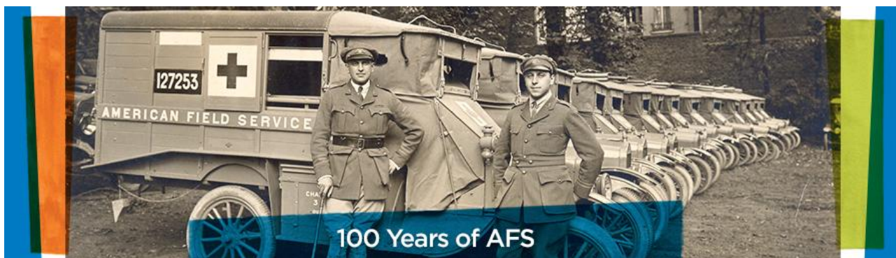
AFS blev stiftet i april 1915 af A. Piatt Andrew